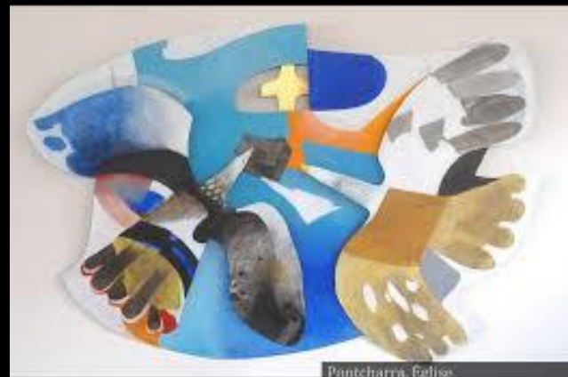
Pentharra, Egiles. Ozeux, 2001. Sculpture en métal